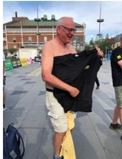
Byte av kläder SM-veckan Sommar 2023!