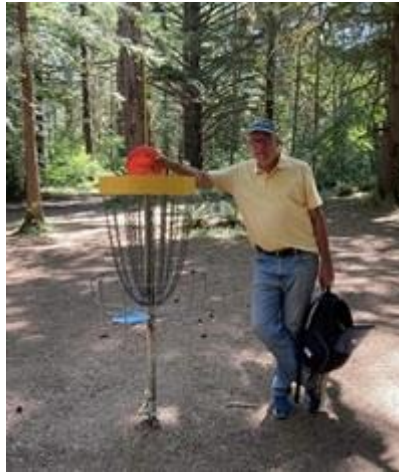
Milo Mciver, Oregon!