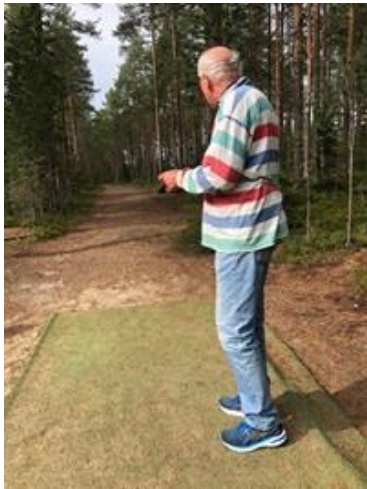
Wasteland Discgolf, Överklinten utanför Robertsfors

Skulle nog tro det, även om jag numera lägger ner mycket mera tid på discgolf.