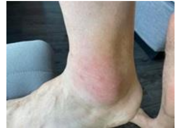
Ett snedtramp i ett jordgetingbo!