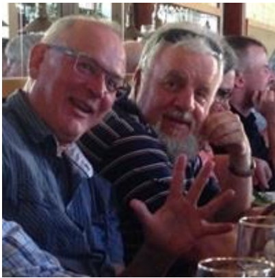
Klubbmiddag SM 2016 i Malmö!

Det första var 1988. The best is yet to come ☺