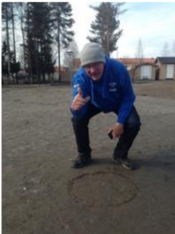
Så här ritar man en ring!

Försöker att inte gräma mig över det som varit utan istället dra lärdom och se framåt.