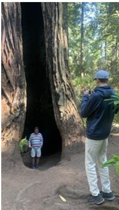
Redwoodskogen i Kalifornien!