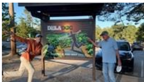
Spel i DeLaVeaga DC i Kalifornien