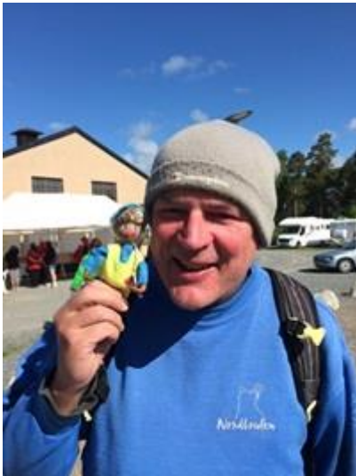
DM i Sollefteå 2016!