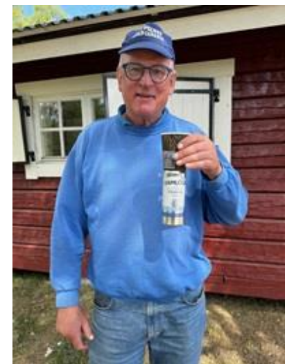
Trolleri i Njurunda!