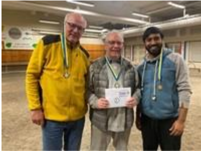
Silver i Öt under Köldknäppen 2022!