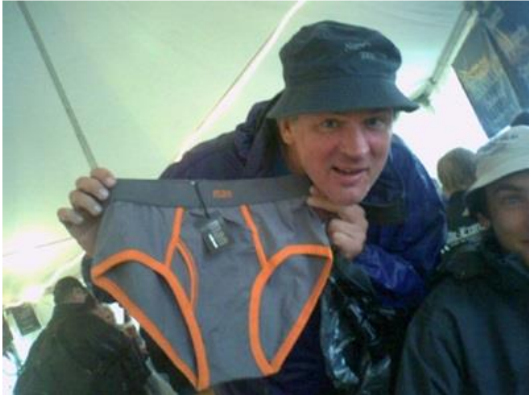
Med ett par fina kalsonger!

/Intervjun gjord av Magnus Sandberg, webbredaktör NSBF juni 2024