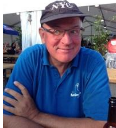
SM 2016 i Malmö!