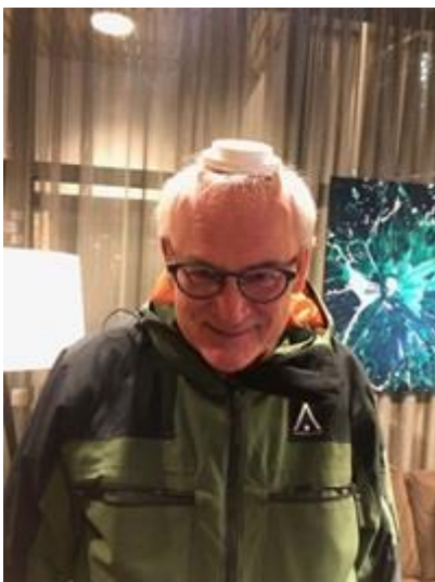
Med en snygg huvudbonad!