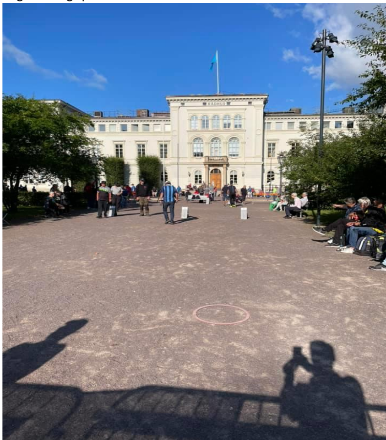
SM i Jönköping

Året har till stor del präglats av Coronapandemin, med inställt SM i Jönköping 2020, och inställt SM i Lindvallen 2021, var kommittén övertygad om att försöka få till någon form av SM. Idén kring distriktsvisa kval dök upp, och vi sammankallade alla distrikten för att stämma av hur de såg på det. Alla var överens om att genomföra detta gemensamt, och det blev väldigt lyckat. SM genomfördes i singel, dubbel, mixeddubbel och trippel i alla klasser, och spelplatsen var Rådhusparken mitt i centrala Jönköping. Vi lärde oss mycket av detta arrangemang, och samarbetet mellan distrikten var något väldigt positivt.